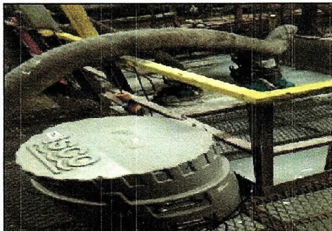
Fotografía 1: Equipo Automático Instalado