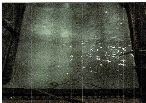
Fotografía 3: Punto de Monitoreo